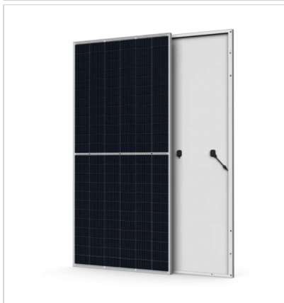
ELECTRICAL DATA (STC)